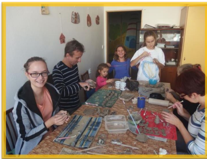
Setkání při výrobě keramiky

který si jen málokdo, kdo nepečuje o dítě s autismem, umí představit. Vzájemná setkání rodin s radostí vítali zejména ti rodiče, kteří se kvůli problémovému chování svého dítěte s autismem nemohou podobných aktivit se svými dětmi nikde jinde zúčastnit. V prostorách spolku mohou být spolu jak děti s autismem tak jejich sourozenci. Na některé aktivity bylo zajištěno hlídání