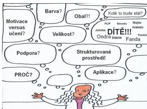
Proč vlastně využívat iPad pro osoby s autismem?