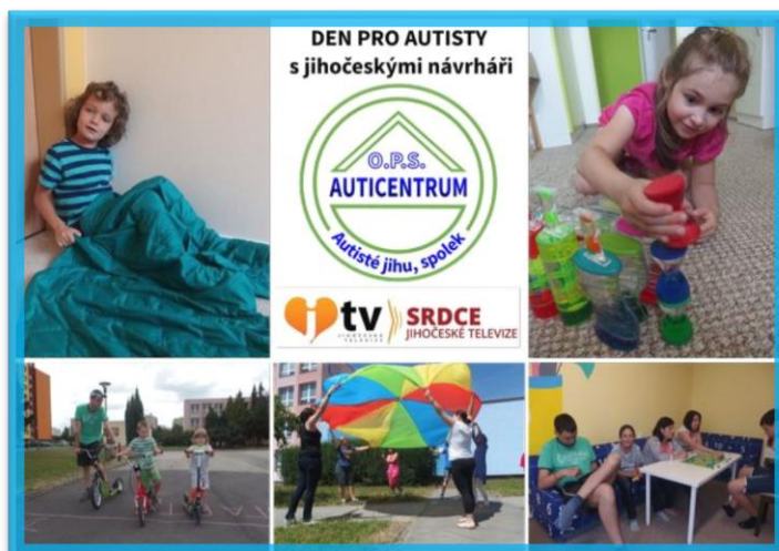
Věci zakoupené z výtěžku charitativní akce

Koloběžky, dětskou sedací soupravu a barevný padák, to jsou věci, které jsme pro děti s autismem mohli zakoupit z výtěžku charitativní akce Den pro autisty s jihočeskými návrháři, kterou uspořádala Jihočeská televize u příležitosti Mezinárodního dne autismu 2. dubna 2015. Akce se konala v nákupním centru IGY v Č. Budějovicích a zapojilo se do ní sedm jihočeských studií a módních tvůrců, jejichž modely bylo možné na akci zakoupit za speciální cenu.