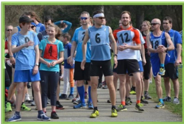
Příprava na startu

V dubnu 2015 se konal již III. ročník Modrého běhu, který byl naším příspěvkem k celosvětové kampani „Light it Up Blue“ (Rozsviťme se modře) na podporu lidí s poruchami autistického spektra. Opět se běželo v lesoparku Stromovka v Českých Budějovicích. Běžely se tři různě obtížné okruhy a pro děti byl opět připraven okruh se zábavnými úkoly. Celkem se letošního Modrého běhu zúčastnilo 230 malých i velkých závodníků.