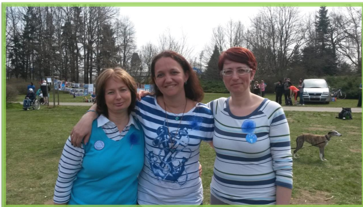
Rodiče – příprava III. ročníku Modrého běhu

Z důvodu nárůstu počtu rodin využívající služeb spolku, požadavků rodičů na odbornost personálu starajících se o rozvoj jejich dětí s autismem prostřednictvím terapeutických a aktivizačních činností a provozní náročnosti těchto aktivit, bylo zapotřebí oddělit organizačně i finančně spolkové aktivity rodičů a aktivity sloužící výhradně osobám s autismem. Proto mezi nejvýznamnější změny roku 2015 patřilo přenechání některých volnočasových aktivit, které již spolek nedokázal personálně ani finančně zajistit, organizaci Auticentrum, o.p.s., která tyto aktivity poskytuje jako sociálně aktivizační službu. Rodičům se tak uvolnily ruce a mohly se začít věnovat aktivitám pomáhajícím celé rodině a sourozencům.