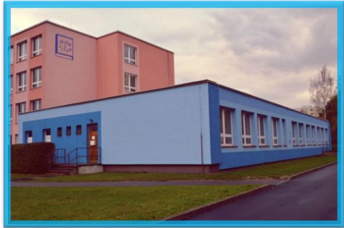
V roce 2015 využívalo služeb spolku 52 rodin pečujících o osobu s autismem

Nejdůležitější pro rodiny bylo to, že se v těchto prostorách cítí dobře. Rodiče se nemusejí obávat neustálých připomínek a kritik směřujících vůči výchově či chování jejich potomka na veřejnosti. Sourozenci zde našli kamarády, kteří mají podobně „zvláštní“ sourozence. Toto vše přináší úlevu od každodenního stresu,