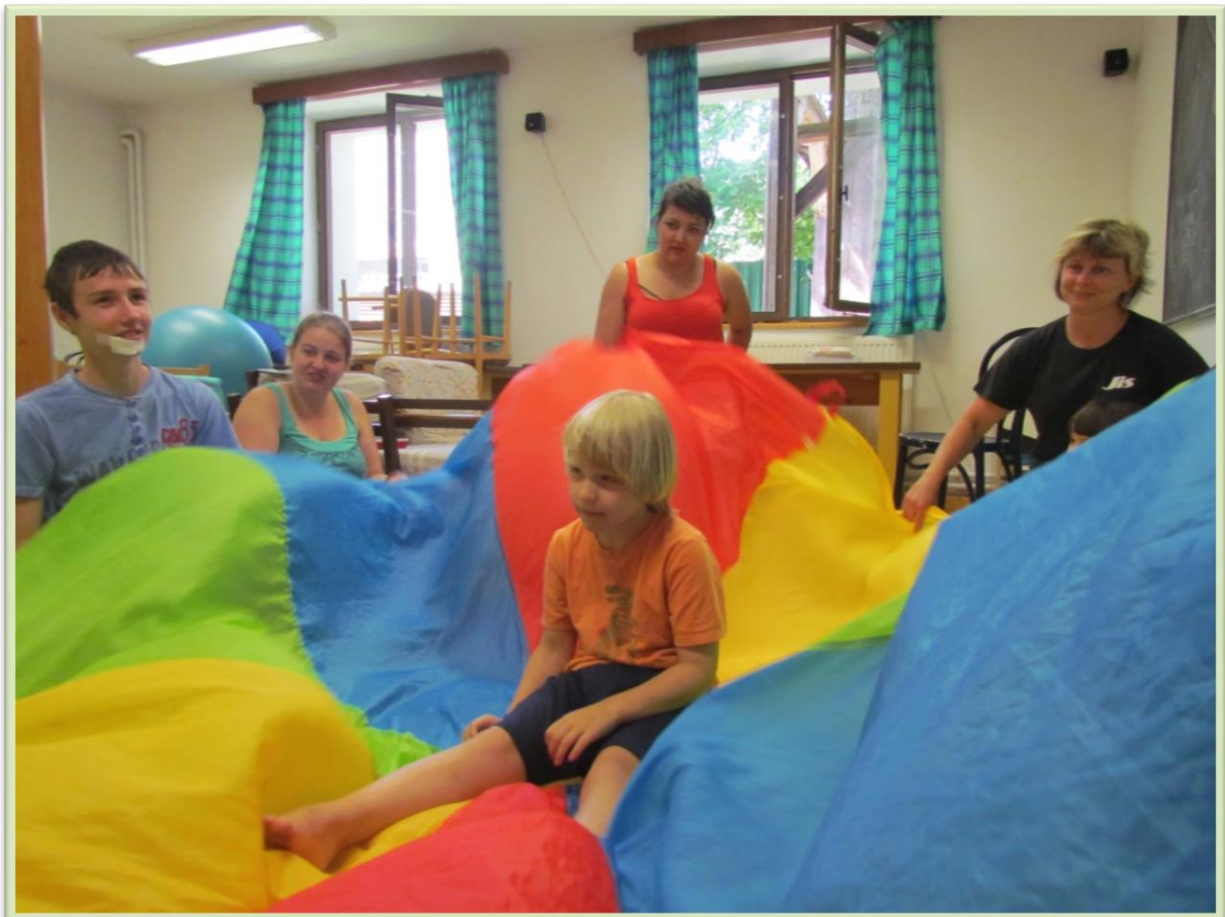
Z pobytu v Bukové...

Všechny letošní aktivity spolku směřovaly k tomu, aby i přesto, jak náročná péče o dítě s autismem je, rodiče viděli smysl v tom, že jejich péče dítěti pomáhá, že každý maličký posun v porozumění dítěti a naopak, je velká radost, že oni ani sourozenci nejsou v této nelehké životní situaci úplně sami, a aby se laická i odborná veřejnost dozvěděla o tom, jak lze lidem s autismem pomoci.