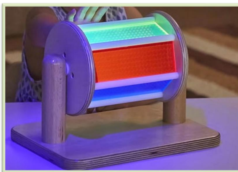
Tak toto je relaxace...

Díky podpoře veřejnosti a ČSOB, a.s. se organizaci Autisté jihu podařilo získat finanční podporu na vybudování nového relaxačního koutku pro osoby s autismem.