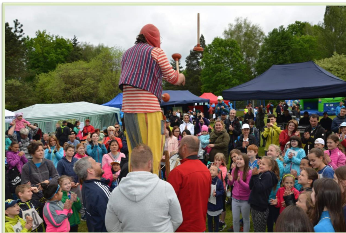
Každoroční osvětová a charitativní akce Modrý běh