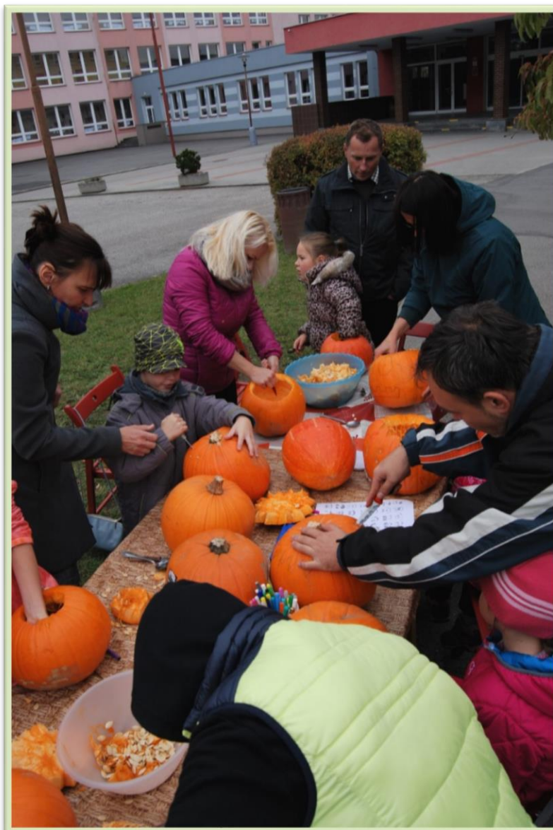
Takto urputně děti ještě nikdy nepracovaly...

Podzimní setkání rodin bylo spojené s večerní oslavou Halloweenu, která byla ve znamení dýní, masek a strašidelné výzdoby prostor. Oslavu všechny děti zvládly, každý si užil něco jiného. Někteří usilovně dlabaly dýně, jiní si oblékli strašidelné masky. Po setmění se děti vydaly stejně jako v loňském roce na světýlkový průvod po okolí.