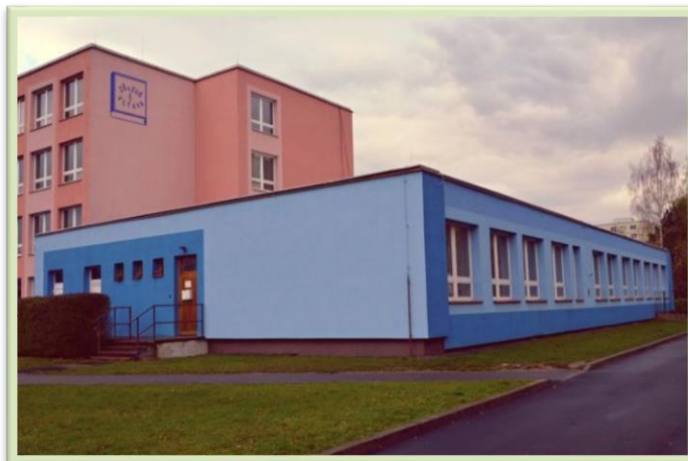
„Modré“ sídlo spolku v ZŠ a ZUŠ Bezdrevská

Nejdůležitější pro rodiny je to, že se v těchto prostorách nemusejí obávat neustálých připomínek a kritik směřujících vůči výchově či chování jejich potomka na veřejnosti. Sourozenci zde našli kamarády, kteří mají podobně „zvláštního“ sourozence. Toto vše přináší úlevu od každodenního stresu, který si jen málokdo, kdo nepečuje o dítě s autismem, umí představit.