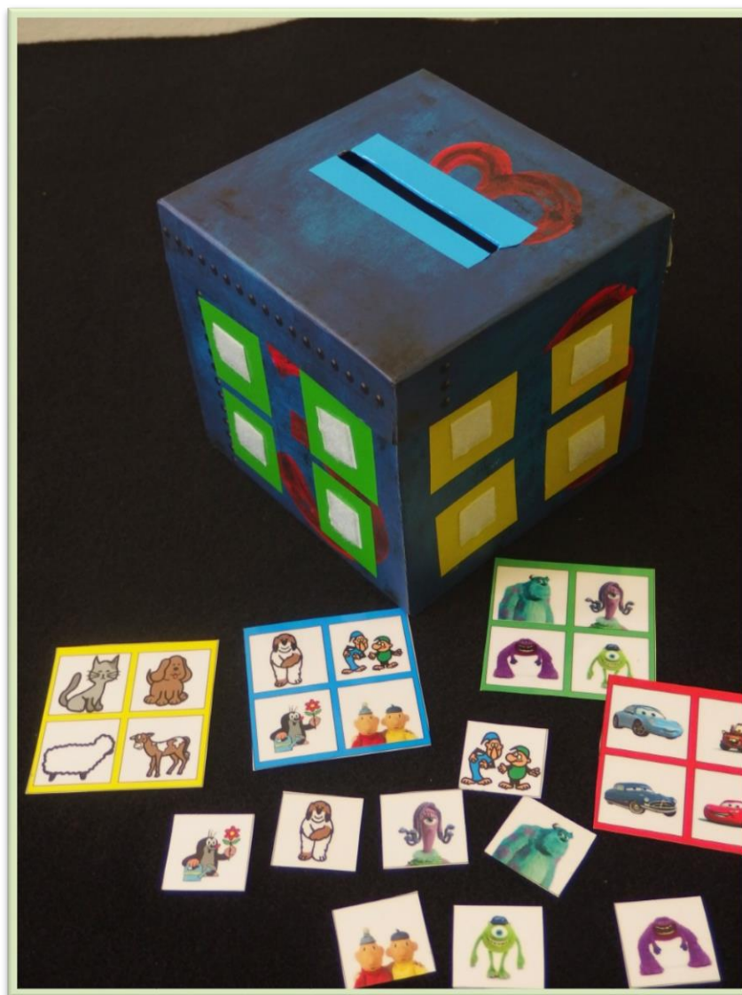
Tato speciální pomůcka má mnoho využití

Jihočeské univerzity. Mnozí z nich nám po celý rok pomáhali při akcích jako dobrovolníci.