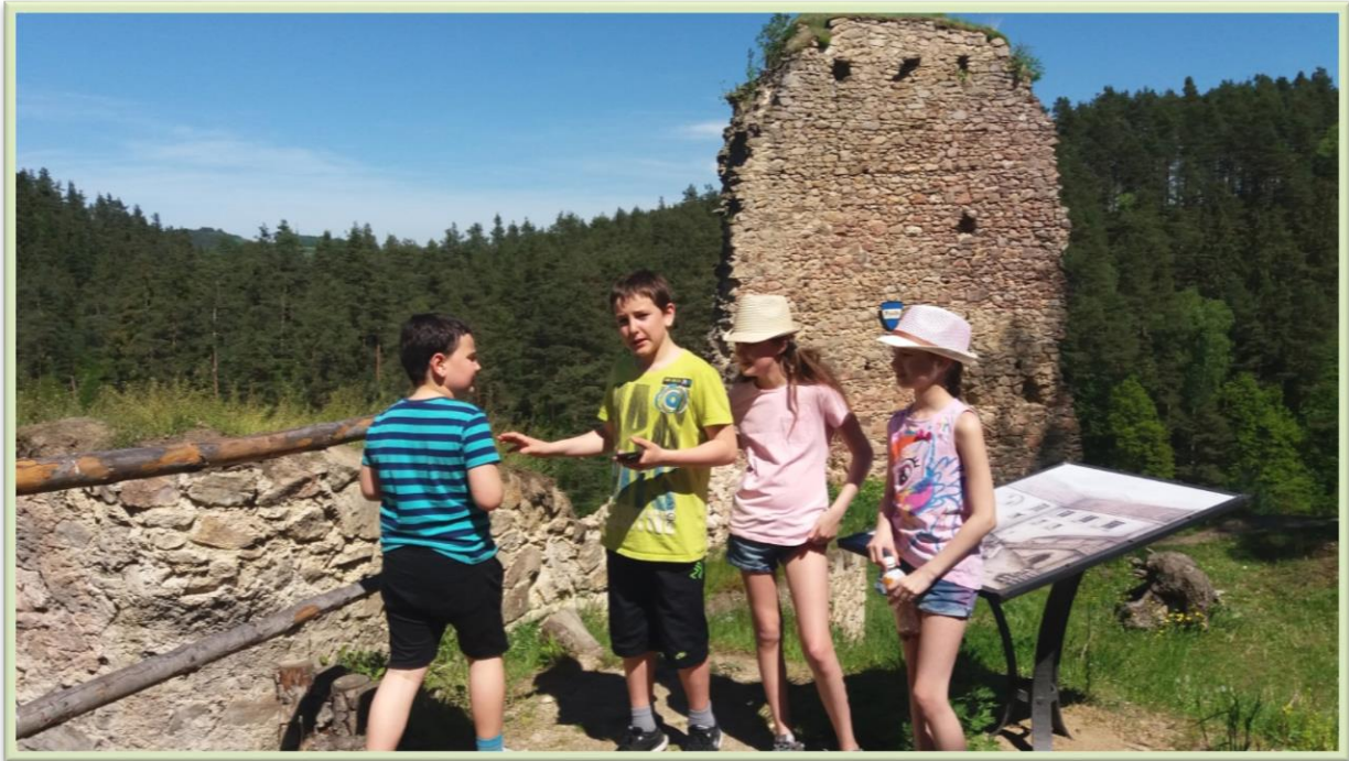
Vzhůru na Pořešín...

„Společně se to lépe táhne“ aneb s dětmi s autismem na cestách... Letos se nám podařilo uspořádat několik zajímavých výletů pro rodiny. Vše bylo pečlivě naplánované, tak aby výlet zvládly i děti s autismem.