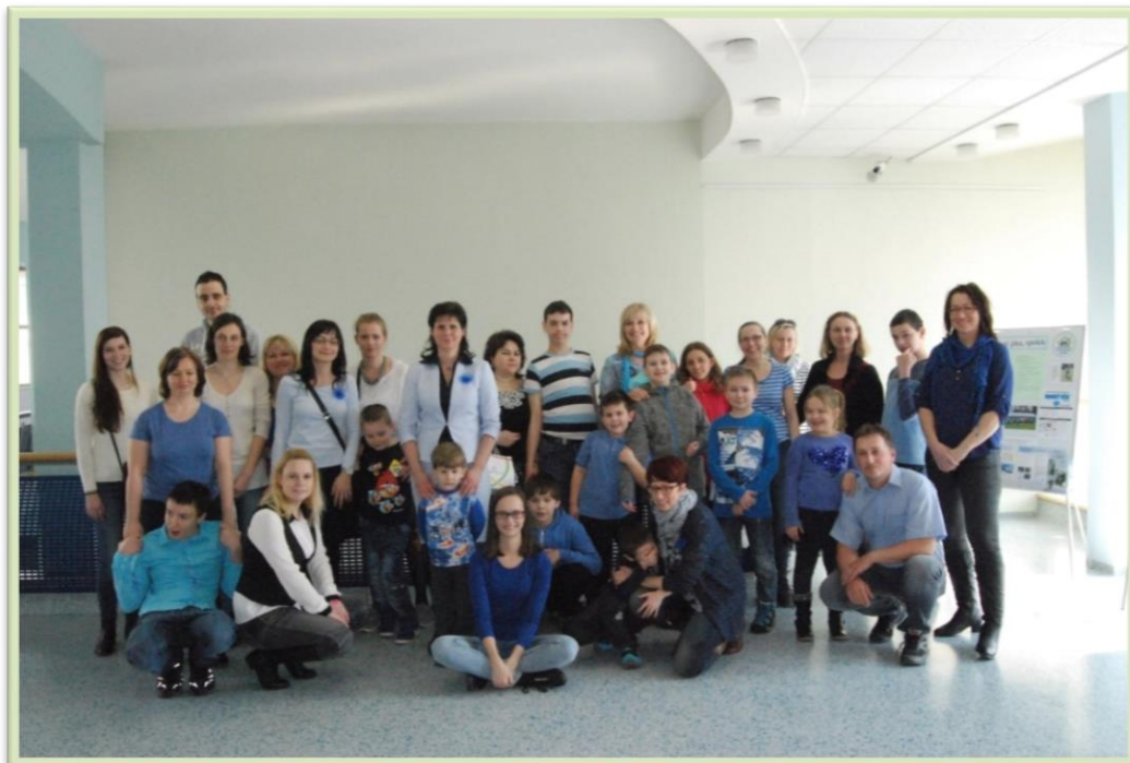
Bylo neuvěřitelné, jak děti s autismem výstavu zvládly... společné foto.