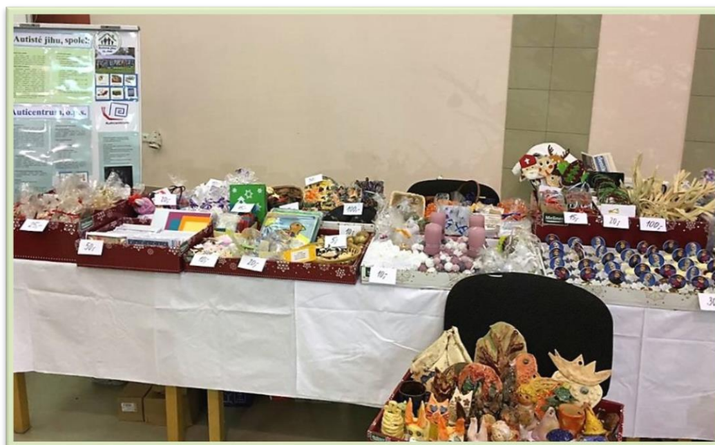
Vánoce jsou za dveřmi...

Na prosincových Adventních trzích na Výstavišti v Českých Budějovicích jsme prodávali vánoční dárečky - dekorativní a upomínkové předměty, které rodiče a děti vyráběli během celého roku.